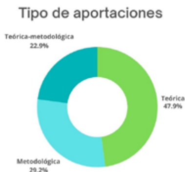
Gráfica 1. Tipo de aportación que se ha hecho en los eventos a los estudios de riesgo, vulnerabilidad social y desastres.